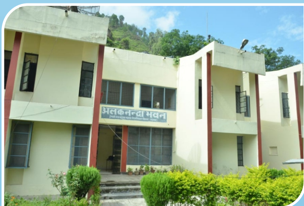
Alaknanda Girls' Hostel, Srinagar Campus