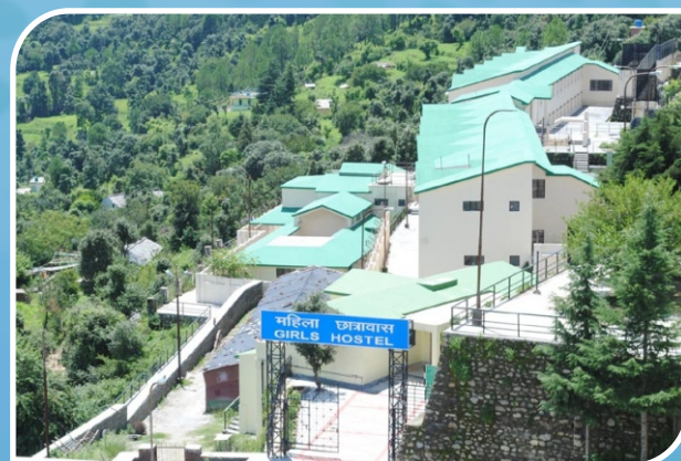
Balganga Girls' Hostel, Tehri Campus