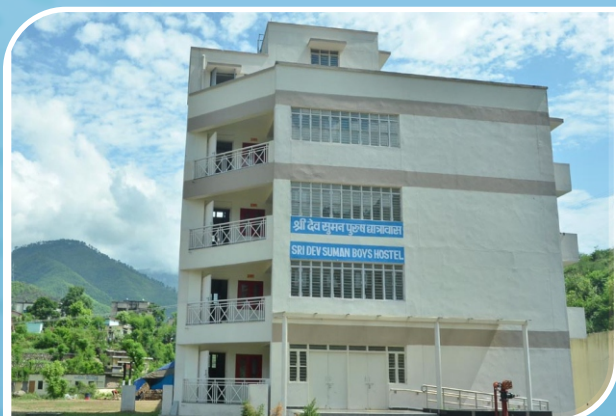
Sridev Suman Boys' Hostel, Chauras Campus