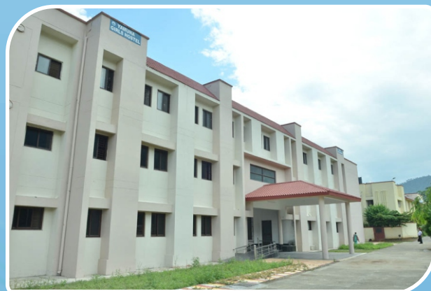
Yamuna Girls Hostel Chauras Campus