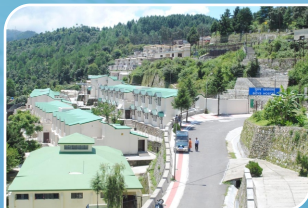
Boys' Hostel, Tehri Campus