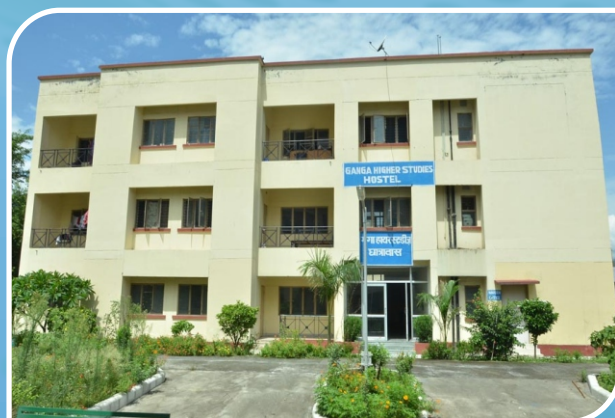
Ganga Higher Studies Hostel, Chauras Campus