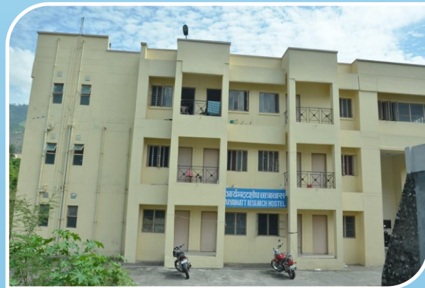
Aryabhata Research Hostel, Chauras Campus