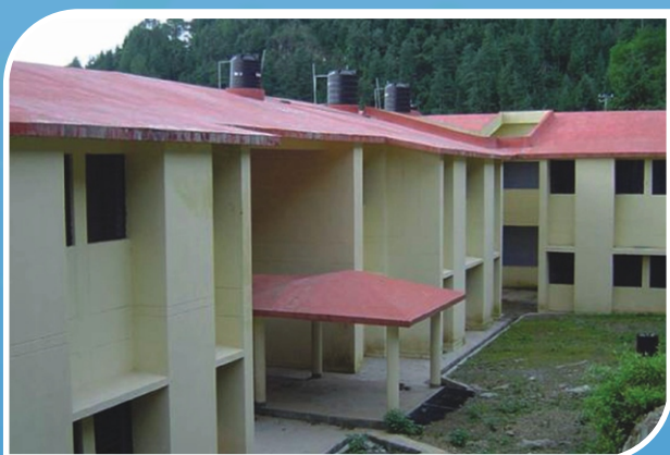
Boys' Hostel, Pauri Campus