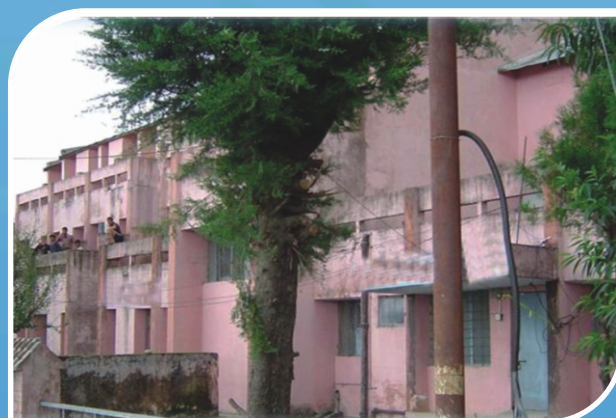
Girls' Hostel, Pauri Campus