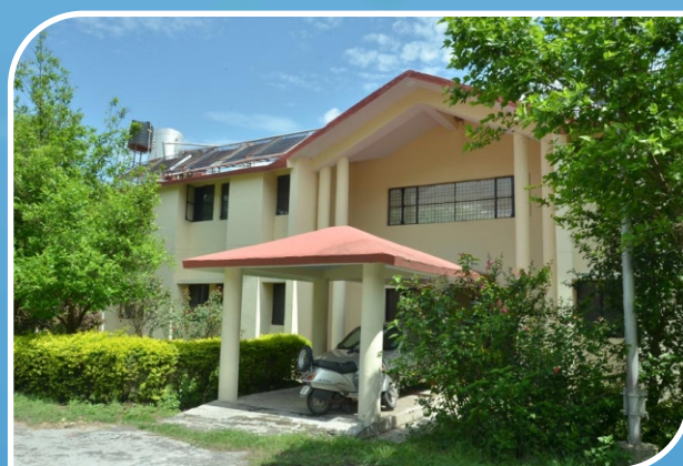
Mandakani Girls' Hostel, Chauras Campus