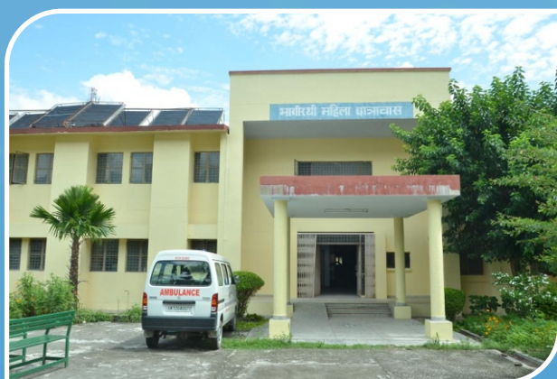
Bhagirathi Girls' Hostel, Chauras Campus