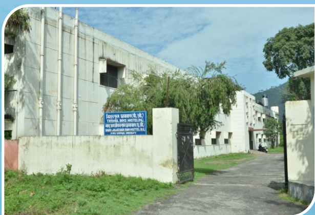
Trishul Boys' PG. Hostel, Srinagar Campus