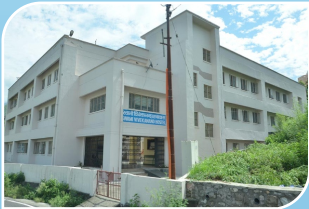
Swami Vivekanand Hostel, Chauras Campus