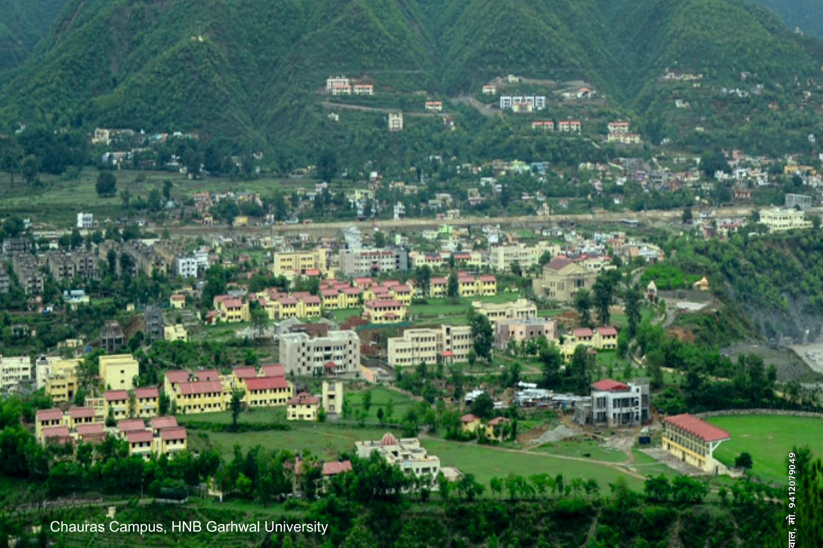
Chauras Campus, HNB Garhwal University