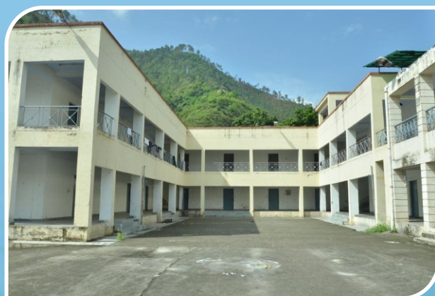
BJJR Boys' Hostel, Srinagar Campus