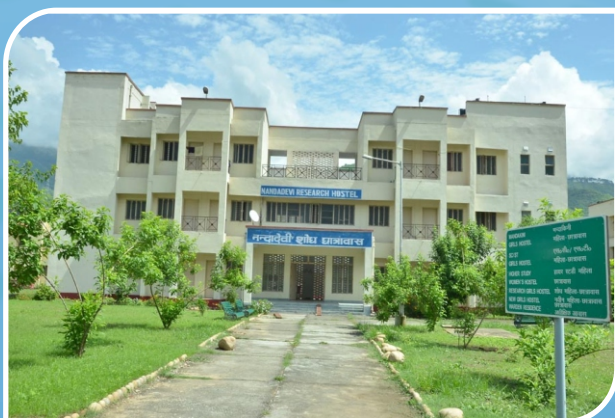
Nanda Devi Research Hostel, Chauras Campus